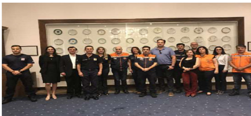
Apresentação do Plano Local de Resiliência no Palácio dos Bandeirantes em São Paulo. (dezembro 2018)