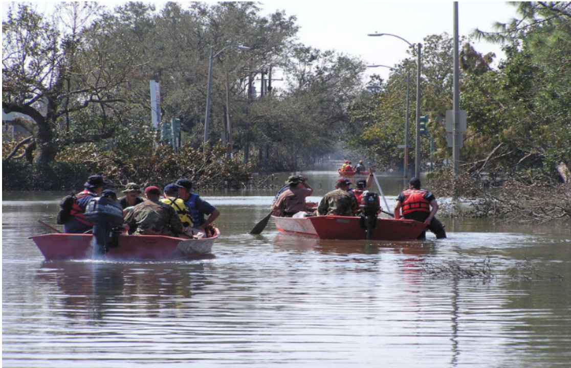
Os barcos de resgate levam pessoas através de ruas inundadas em Nova Orleans após o furacão Katrina, 11 de setembro de 2005.