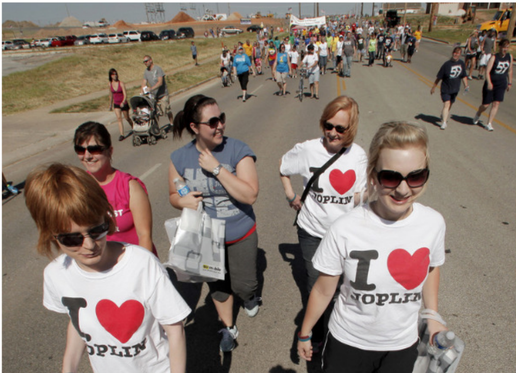
Em uma cerimônia de 2012, moradores de Joplin, Missouri, seguem a rota de um enorme tornado que rasgou a cidade um ano antes, matando 161 pessoas.

Organizações sem fins lucrativos como a Cruz Vermelha Australiana, BoCo Strong em Boulder, Colorado e a Organização Regional de Gerenciamento de Emergência de Wellington da Nova Zelândia agora levam a sério a capital social enquanto trabalham para construir a resiliência . Nesses programas, os moradores locais trabalham junto às organizações da sociedade civil para ajudar a fortalecer as conexões, criar redes de reciprocidade e pensar sobre as necessidades da área. Ao invés de esperar por assistência do governo, essas áreas estão criando seus próprios planos para mitigar futuras crises.