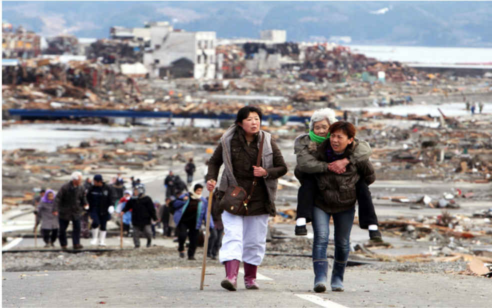
Os sobreviventes deixam Tohoku um dia após o terremoto e o tsunami de 11 de março de 2011.

O conselho padrão sobre a preparação para desastres centra-se na construção de abrigos e armazenamento de coisas como alimentos, água e baterias. Mas a resiliência - a capacidade de recuperação de choques, incluindo desastres naturais - vem de nossas conexões para outros, e não de infra-estrutura física ou kits de desastre.