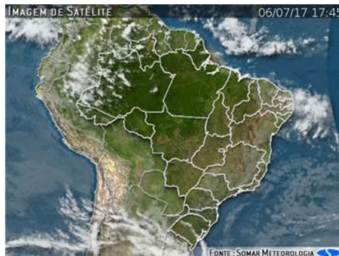
IMAGEM DE SATÉLITE E ACUMULADO DE CHUVA DAS ÚLTIMAS 72 HORAS