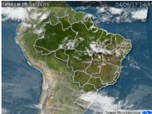
IMAGEM DE SATÉLITE E ACUMULADO DE CHUVA DAS ÚLTIMAS 72 HORAS