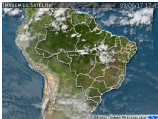
IMAGEM DE SATÉLITE E ACUMULADO DE CHUVA DAS ÚLTIMAS 72 HORAS