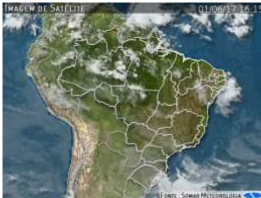
IMAGEM DE SATÉLITE E ACUMULADO DE CHUVA DAS ÚLTIMAS 72 HORAS