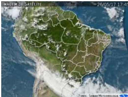
IMAGEM DE SATÉLITE E ACUMULADO DE CHUVA DAS ÚLTIMAS 72 HORAS