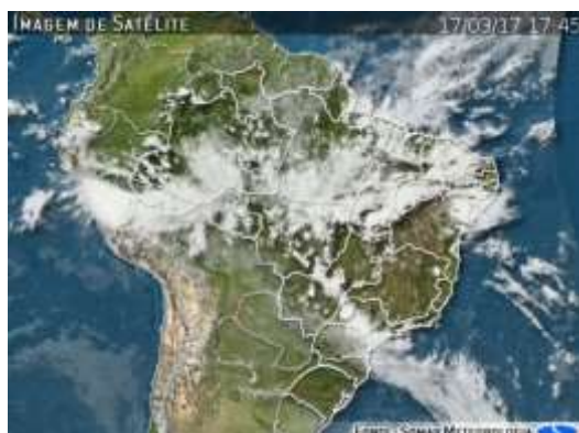
IMAGEM DE SATÉLITE E ACUMULADO DE CHUVA DAS ÚLTIMAS 72 HORAS