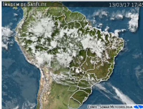
IMAGEM DE SATÉLITE E ACUMULADO DE CHUVA DAS ÚLTIMAS 72 HORAS