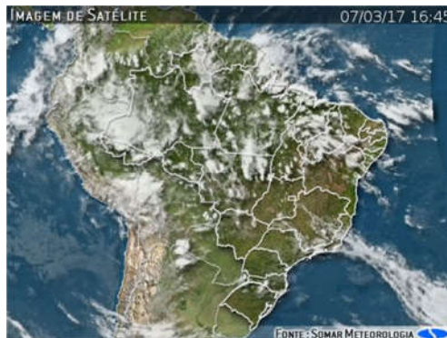
IMAGEM DE SATÉLITE E ACUMULADO DE CHUVA DAS ÚLTIMAS 72 HORAS