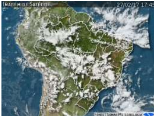
IMAGEM DE SATÉLITE E ACUMULADO DE CHUVA DAS ÚLTIMAS 72 HORAS