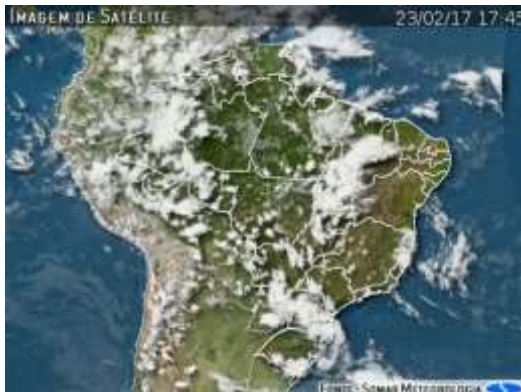
IMAGEM DE SATÉLITE E ACUMULADO DE CHUVA DAS ÚLTIMAS 72 HORAS