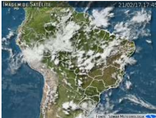
IMAGEM DE SATÉLITE E ACUMULADO DE CHUVA DAS ÚLTIMAS 72 HORAS