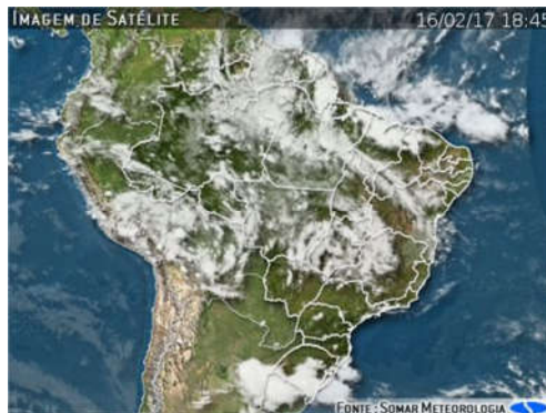
IMAGEM DE SATÉLITE E ACUMULADO DE CHUVA DAS ÚLTIMAS 72 HORAS