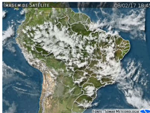
IMAGEM DE SATÉLITE E ACUMULADO DE CHUVA DAS ÚLTIMAS 72 HORAS