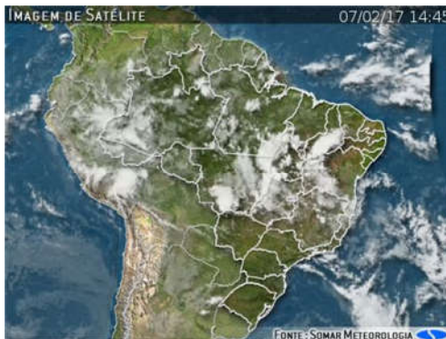
IMAGEM DE SATÉLITE E ACUMULADO DE CHUVA DAS ÚLTIMAS 72 HORAS