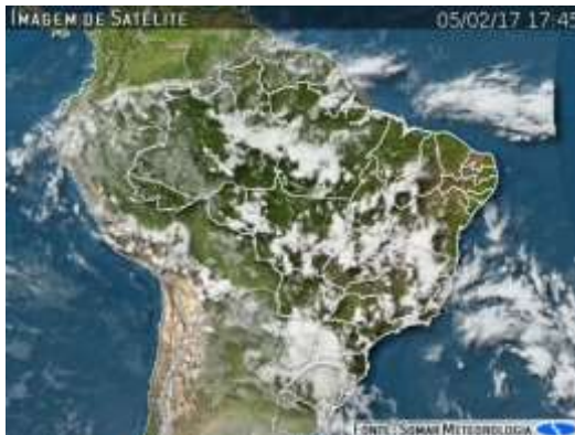
IMAGEM DE SATÉLITE E ACUMULADO DE CHUVA DAS ÚLTIMAS 72 HORAS