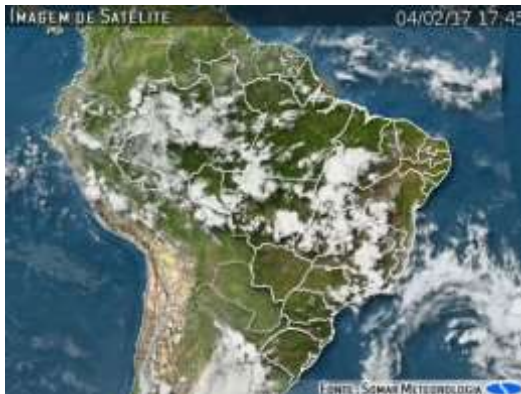
IMAGEM DE SATÉLITE E ACUMULADO DE CHUVA DAS ÚLTIMAS 72 HORAS