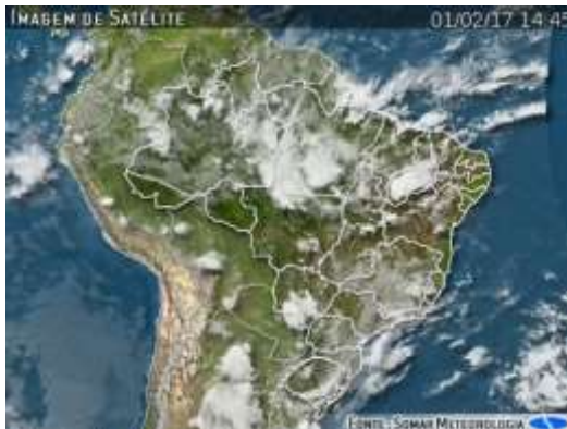
IMAGEM DE SATÉLITE E ACUMULADO DE CHUVA DAS ÚLTIMAS 72 HORAS