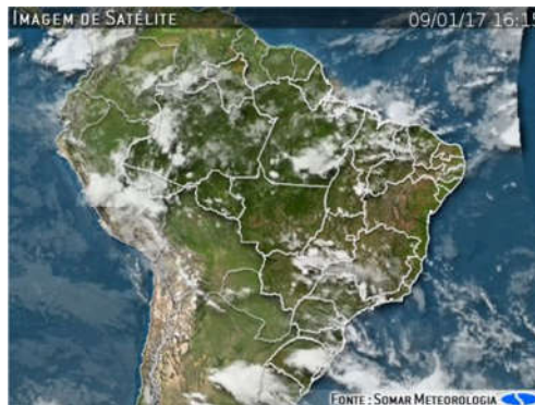
IMAGEM DE SATÉLITE E ACUMULADO DE CHUVA DAS ÚLTIMAS 72 HORAS