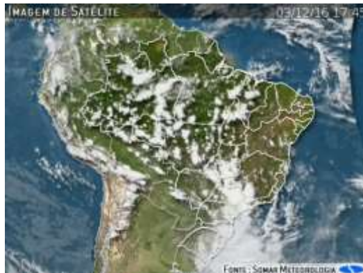
IMAGEM DE SATÉLITE E ACUMULADO DE CHUVA DAS ÚLTIMAS 72 HORAS