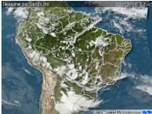
IMAGEM DE SATÉLITE E ACUMULADO DE CHUVA DAS ÚLTIMAS 72 HORAS